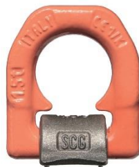
C 830 X a saldare