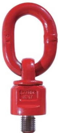
C 800 Grado 80