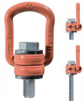
C 806 X Grado 100